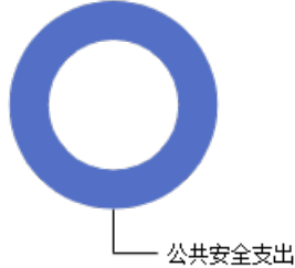
一般公共预算当年拨款结构图

2023年度一般公共预算当年拨款1,014.59万元,主要用于以下方面:公共安全支出1,014.59万元,占100.00%。